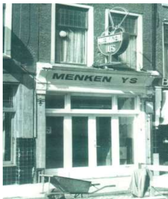
Steenstraat 25, dankzij de reclametekst 'MENKEN YS' is de holle puilijst goed te zien. Zie ook de prachtige neon reclame erboven.

Het oudste beeld van de winkelpui is terug te vinden op tekeningen van een aanvraag voor een vergunning uit 1934 ten behoeve van het wijzigen van de kapverdieping. Hierop staat een winkelpui met twee pilasters (rechthoekige muurverstevigingen) en een hoge puilijst. De ingang van de winkel is aan de rechterkant en ernaast is een groot etalagekozijn op een plint. Op foto's uit 1952 is te zien dat de pilasters van de winkelpui zijn voorzien van natuurstenen kapitelen (bovenstukken) en basementen (verdikte voetstukken).