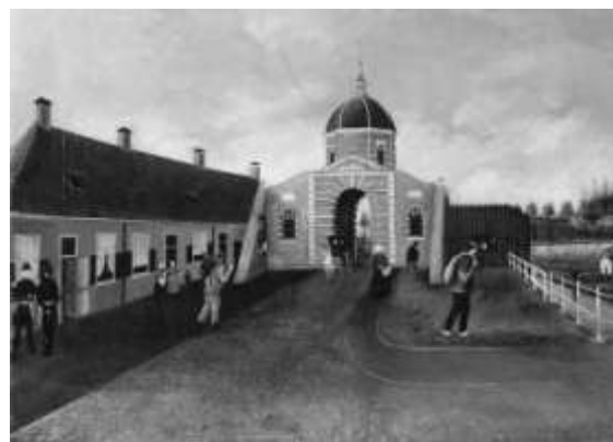
Het stadsgezicht van Haan, detail linksonder

Voorts is op het schilderij het water te zien dat langs de noordzijde (rechterkant) van de Morspoort loopt tussen de Morssingel en de Binnenvestgracht. Ook op het plattegrondje van 1860 is deze verbinding terug te zien. Het graven van deze verbinding na het dempen van het grachtje tussen Morsstraat en Galgewater zal niet alleen gedaan zijn om het water voor kleine boten toegankelijk te houden. In die tijd kwamen immers alle rioleringen van de huizen nog op het open water uit. Enige doorstroming van het grachtje was dus niet overbodig, maar je kunt je afvragen of het, zoals op het schilderij te zien is, verstandig was om er de was in te spoelen. In ieder geval is de geschilderde voorstelling van het water, inclusief het bruggetje uiterst rechts over de Binnenvestgracht in overeenstemming met de situatie van rond 1860.