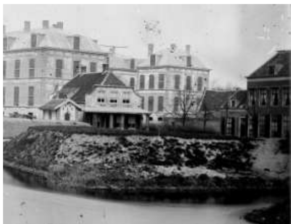
Aanzicht van het nieuwe ziekenhuis vanaf de Morsbrug, RAL circa 1870. Op de voorgrond de molenaarswoning met bijgebouwtje

Blijkbaar bleef de molenaarswoning langer staan. Opvallend is de grote gelijkenis tussen het geschilderde en gefotografeerde huis en bijgebouwtje.