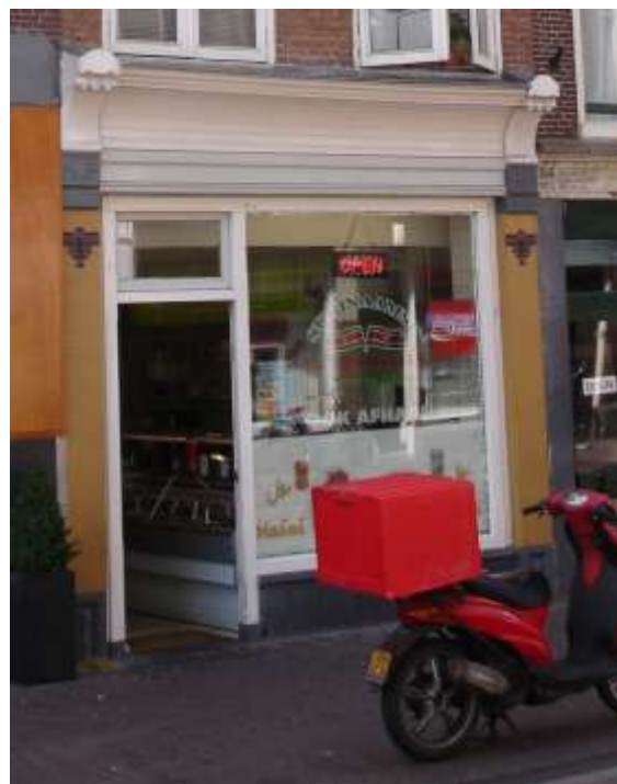
Steenstraat 25 na de renovatie, fig. 2

Na een aanloop van ten minste vier jaar wordt de winkelpui van Steenstraat 25 aangepakt. De opzichtige lichtbak met de schreeuwende kleuren rood en geel verdwijnt. De pilasters worden gestript van de bruine tegels en voorzien van nieuwe met het motief van ruim 50 jaar terug. De natuurstenen basementen en kapitelen worden opgeknapt, een nieuw kozijn en een hogere natuurstenen borstwering worden geplaatst. Het resultaat mag gezien worden, een rustige aanblik waar de bijzondere puilijst direct in het oog springt. Inmiddels is juist aan deze kant van de Steenstraat een groot deel van de winkelpuien opgeknapt of zijn de reclame uitingen tot aanvaardbare afmetingen teruggebracht.