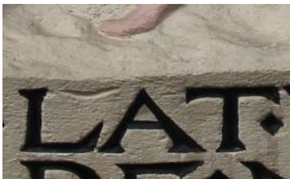
Detail van de gevelsteen met het kerfje

De discussie over het golfje blijkt binnen de Werkgroep Geveltekens van de Vereniging Oud Leiden al lang te zijn gevoerd. In een nota staan allerlei argumenten tegen het inkleuren ervan. Mensen die niet weten dat het hier om een afkorting zou kunnen gaan, zouden alleen maar meer in verwarring geraken.