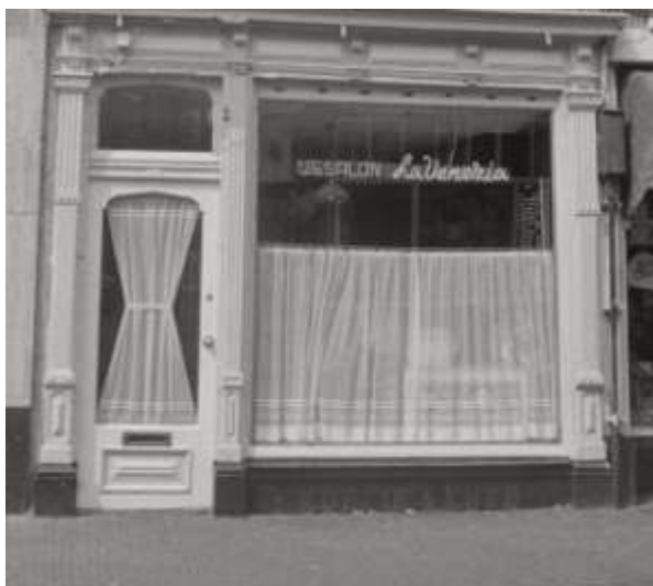
La Venezia in de jaren 70

Jaren van 's ochtends 8 tot 's nachts 3 eisen hun tol. “Toen ik nog geen gezin had werkte ik non-stop en ging ik daarna ook nog eens uit – pure roofofbouw. En dan word je 50. Tja. Dan komt de rekening.”