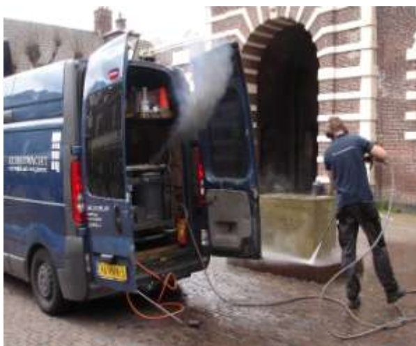
18 april 2014, de kunstwacht reinigt de gedenksteen voor Martinus van der Lubbe