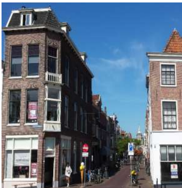
De Morsstraat gezien vanaf de Steenstraat

Een ruime meerderheid wil de Morsstraat als winkelstraat behouden. Een derde ziet wel iets in alternatieve bestemmingen voor langdurig leegstaande panden, maar slechts een enkeling wil het winkelaanbod daadwerkelijk terugdringen. Wat betreft de invulling van het winkelbestand is er een duidelijke voorkeur. De helft wil graag een culturele bestemming, voorzien van woon-/werk winkels. Een kleinere groep (nog geen kwart) geeft aan graag de dagelijkse boodschappen in de Morsstraat te willen doen. Een enkeling ziet de straat als ambachtsstraat of als culinaire straat.