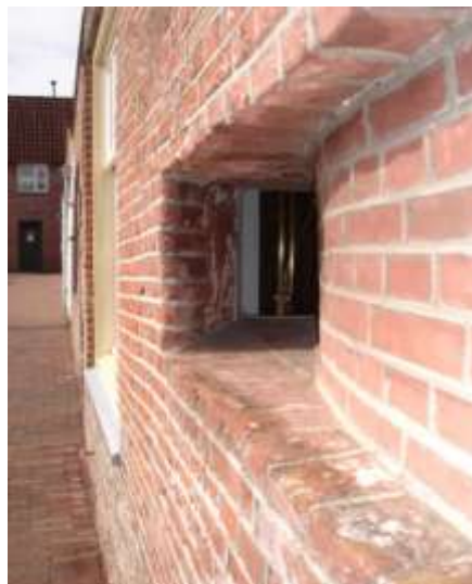
Het schuin in de gevel geplaatste raampje

maken van het beeld dat de beheerder vroeger gezien moet hebben.