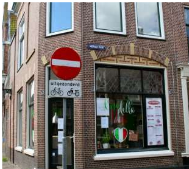
Het restaurant kan je vinden op de hoek van de Morsstraat en de Smidssteeg