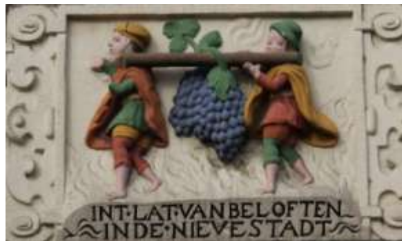
De bewuste gevelsteen van de Beestenmarkt

Een argument waar ik me eigenlijk niet in kan vinden. Liever volledig herstellen dan onvolledig laten, toch?