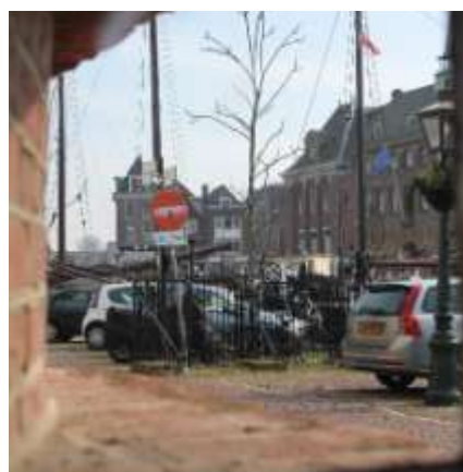
Zicht op de poort

De huidige bewoonster laat mij binnen. Via een van onder tot boven met Delfts blauw betegelde gang kom ik in de woonkamer. Na het verschuiven van een paar meubels kan ik het raampje goed zien. Het is gevat in een omlijsting en voorzien van scharnietjes, maar kan nu niet meer worden geopend. Het uitzicht: een mooi periscopisch beeld over de stoep, naar het zwarte gietijzeren hek, dwars op de kade van het Kort Galgewater.