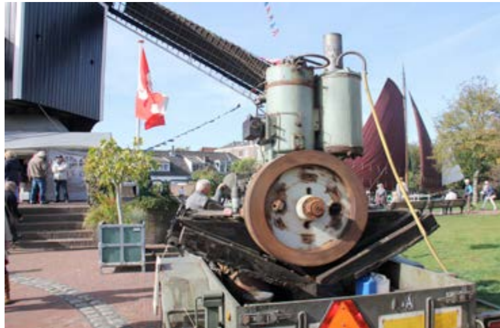
De gloeikopmotor volop in bedrijf, dit keer in Park de Put

Organisatie: Stichting Historische Haven en vele vrijwilligers.