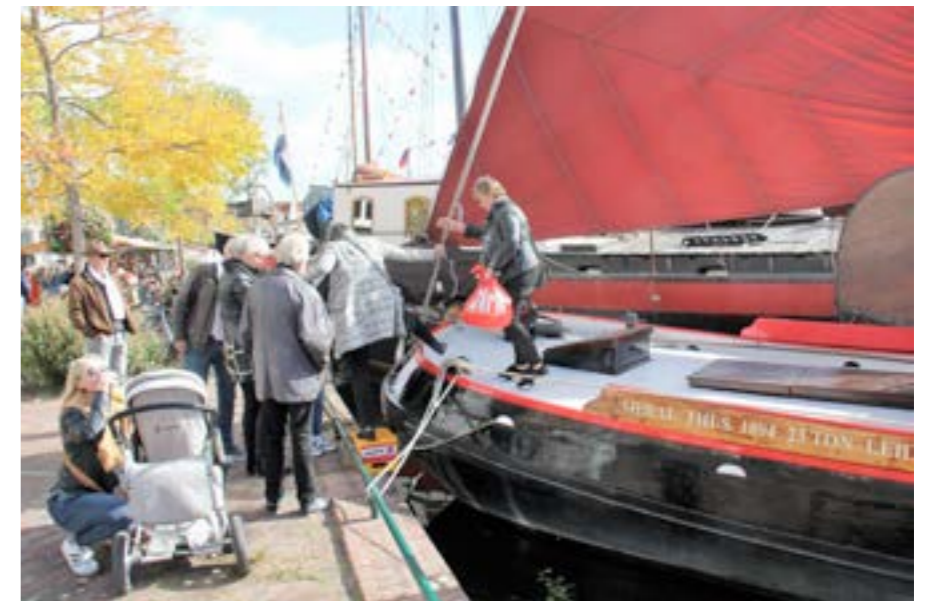
Het skutsje 'Oeral Thus' werd zeer druk bezocht