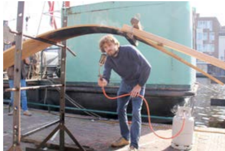
Demonstratie delen rondbranden van de historische scheepstimmerwerf "Klaas Hennepoel"