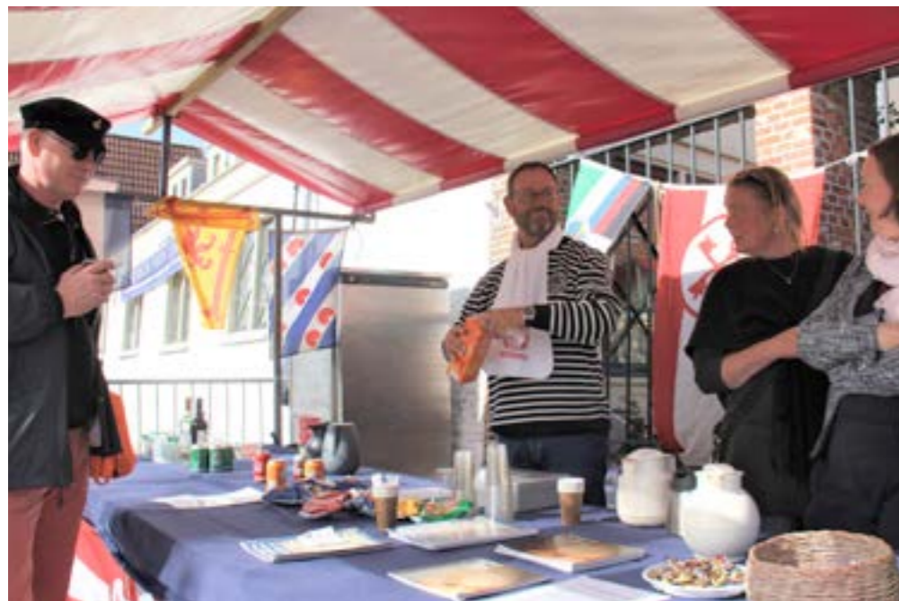
Horecastand van de organisatie, van alles verkrijgbaar