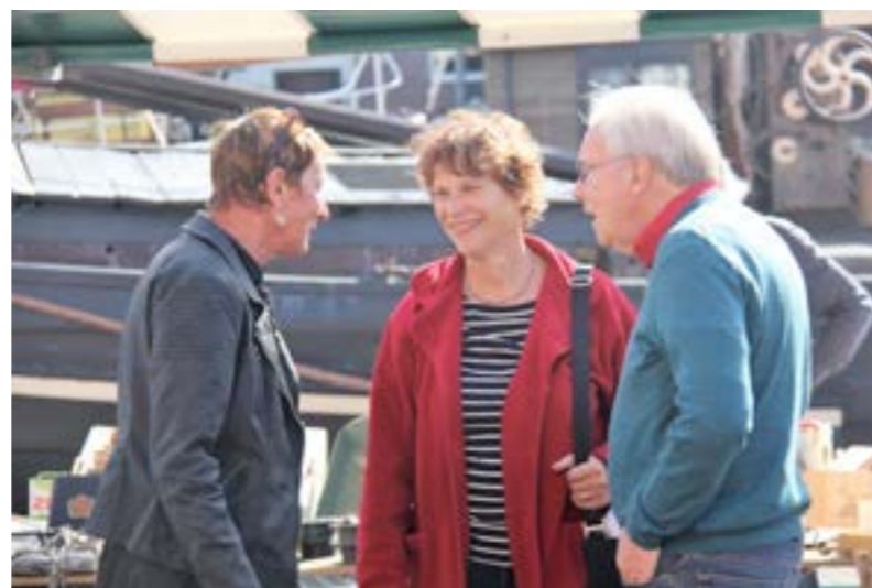
Even gelegenheid om bij te praten