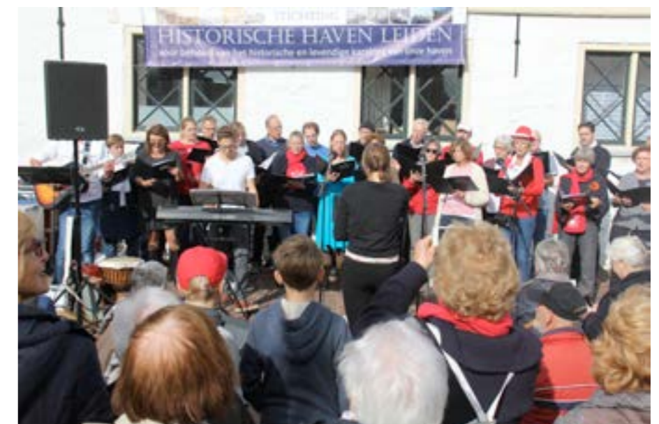
Het Leiden English Choire trad voor de 1ste maal op aan het Kort Galgewater