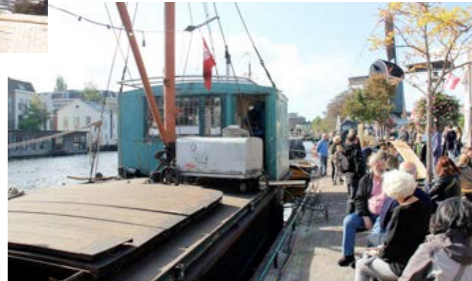
Het bijzondere kantoorship 'Bureau Ailleurs' (voorheen van de firma Groenewegen aan het Utrechtse Veer) lag er ook en was te bezichtigen